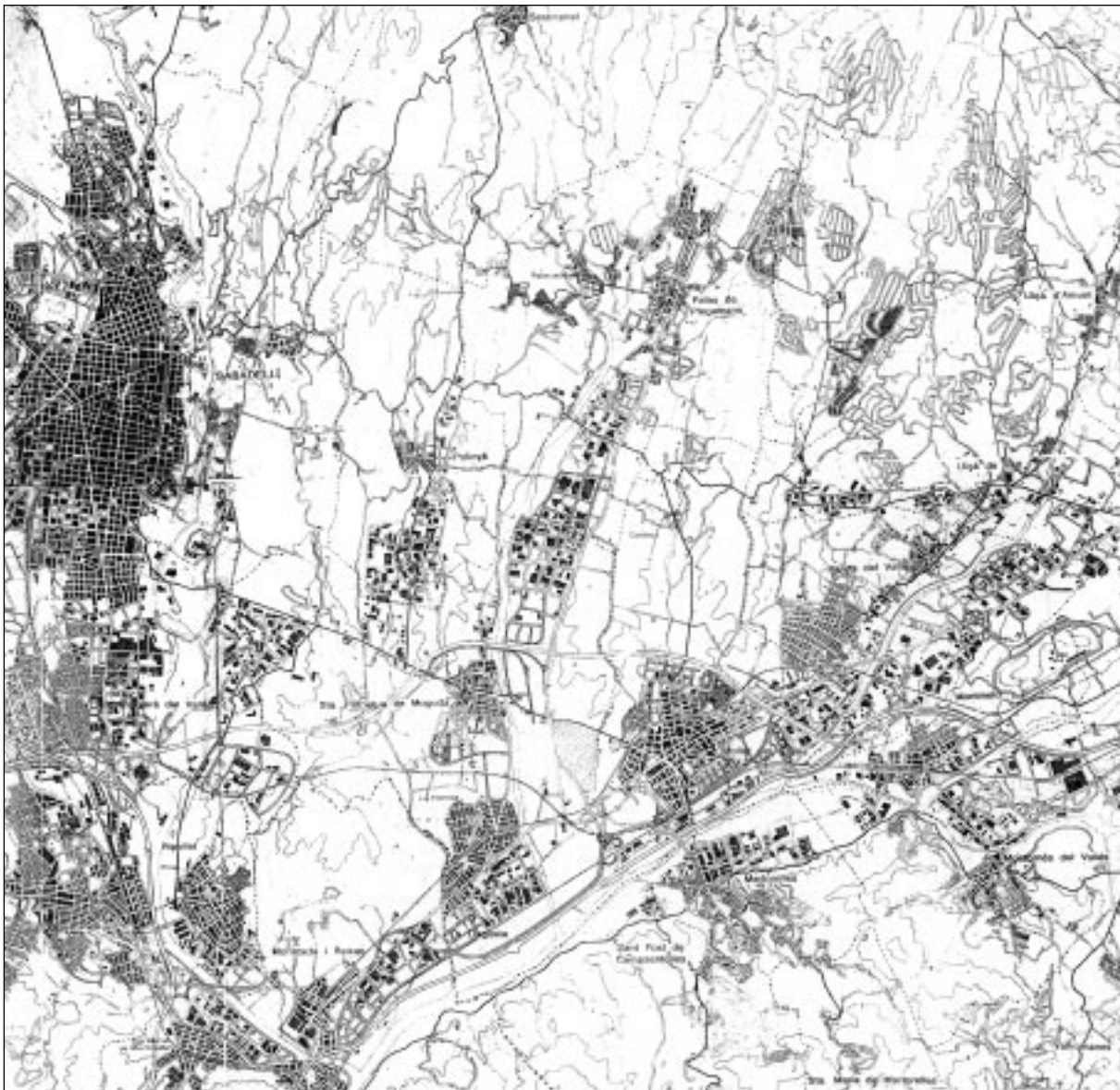
Figura 3. Los cambios recientes, 1986-1992 (riera de Caldes)