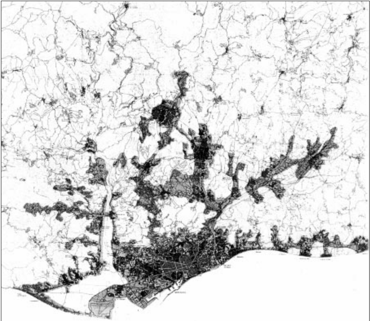
Figura 1. La ciudad real